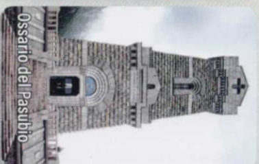
Ossario del Pasubio